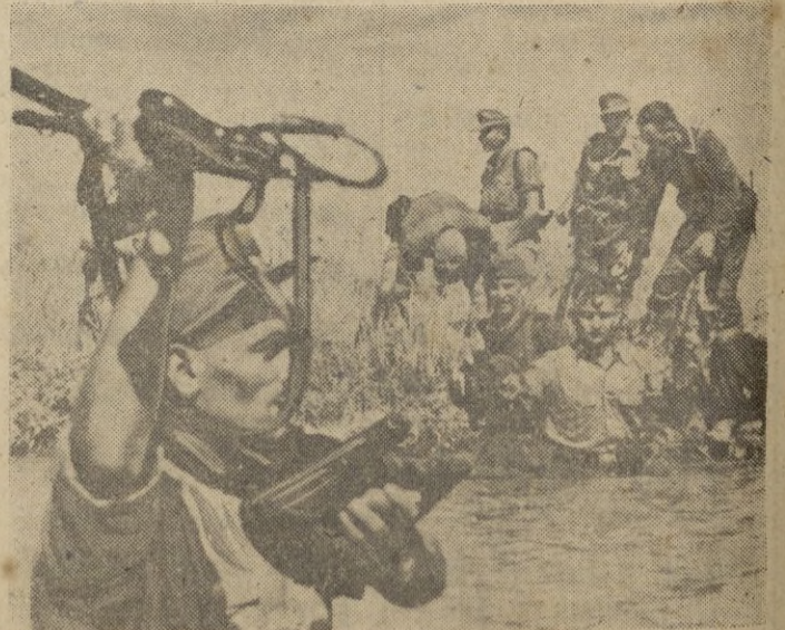
Un grupo alemán de asalto, pasa a la otra orilla del río con el agua al pecho para batir al enemigo