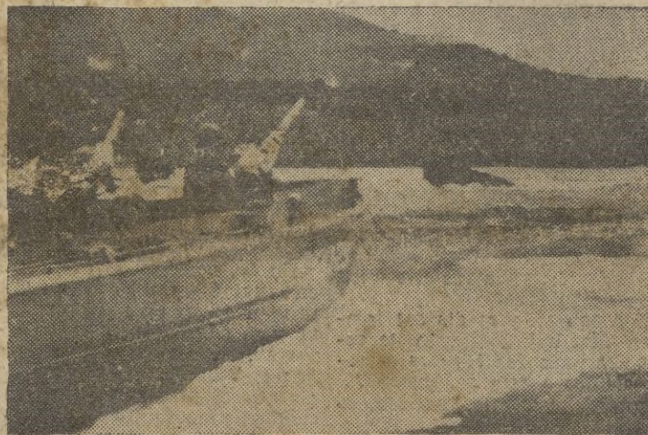
Una lancha rápida armada avanza rumbo a la costa