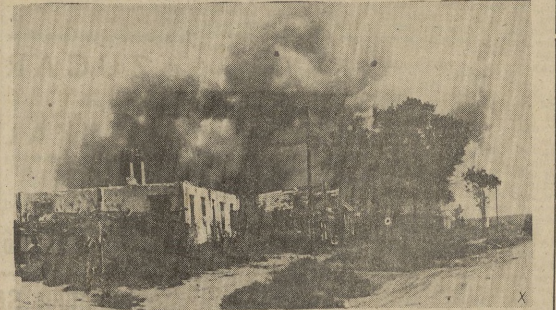
Este pueblo ruso, escenario de la más cruenta lucha, es ya pasto de las llamas, mientras que el decidido combate con el enemigo se bate en reataque alemán.