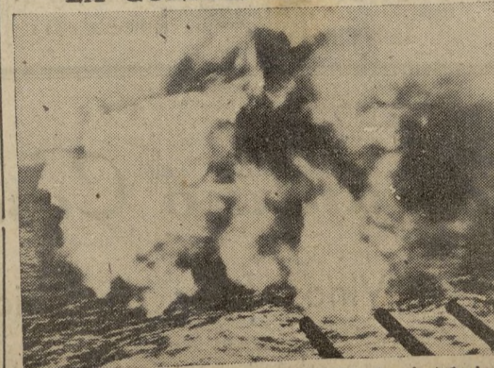
Un crucero norteamericano dispara contra las instalaciones militares de Licata.