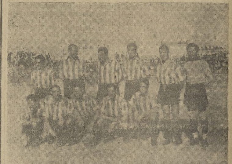
El "Algeciras" que esta tarde juega en nuestro Estadio con tra el "Ceuta", en partido inaugural de la temporada

Para cuanto significo reafirmación indestructible y estrechos lazos de afecto con la noble rivalidad deportiva el Madrid se ofrece al Club Barcelona incondicionalmente, seguro de nallar en su sólida raíz deportiva y patriótica.