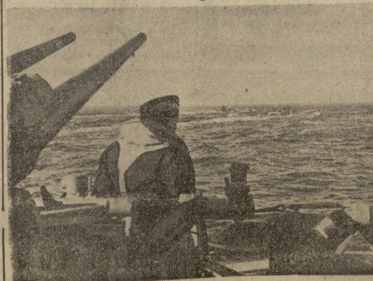
Los destructores alemanes son empleados para proteger a los submarinos contra las sorpresas del aire.

"La propaganda adversaria — dijo — cree que es este el momento de declarar la ofensiva general de la guerra de nervios contra Hungría sembrando la desconfianza contra los dirigentes, mientras tanto de subvertir el orden social, es decir procurando el derrumbamiento del frente interior.