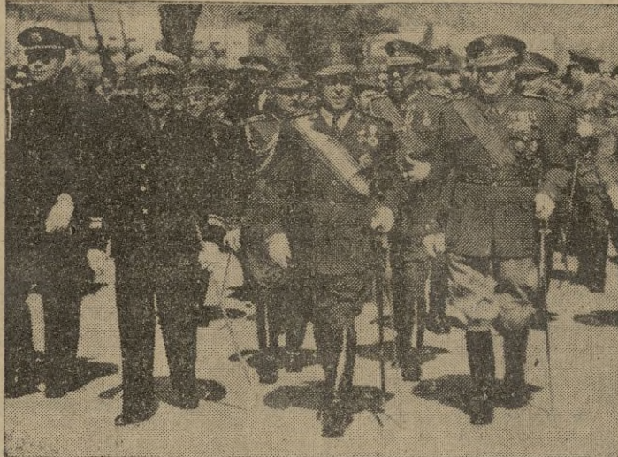
El Excmo. Sr. general Delgado Serrano, jefe del IX Cuerpo de Ejército y otras destacadas autoridades, dirigiéndose a la tribuna, desde donde el pasado sábado presenciaron el brillante desfile celebrado.