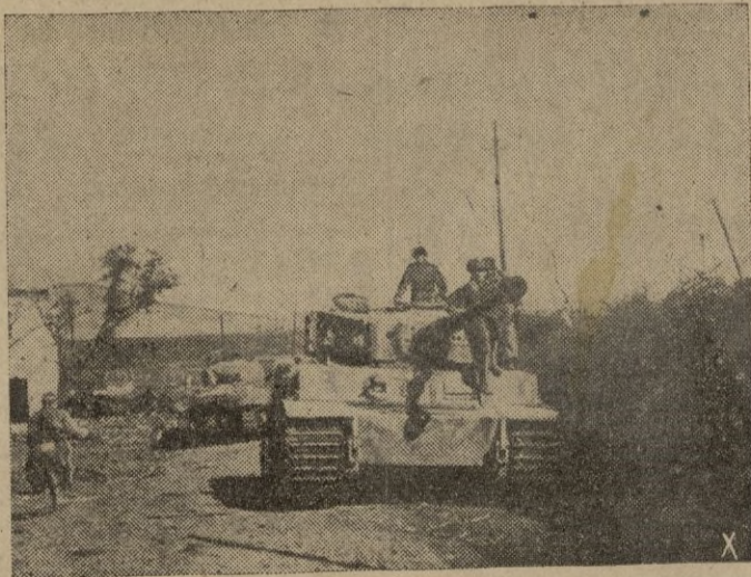
La avanzadilla de una formación blindada alemana ocupa el terreno adecuado para un contraataque en el frente sur italiano