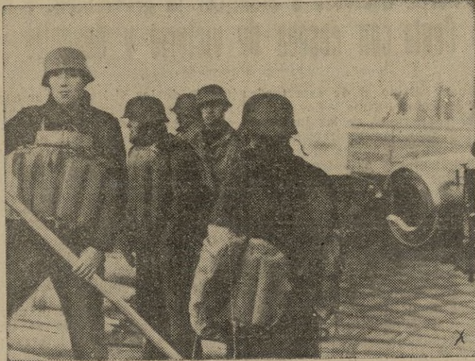
Las fuerzas del Reich se entrenan incansablemente en prácticas defensivas.