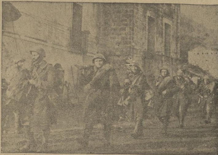
Soldados italianos atraviesan una ciudad camino del frente.