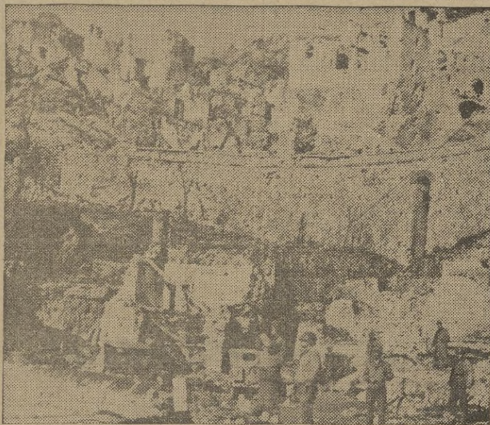
Soldados norteamericanos contemplando las ruinas de San Pietro