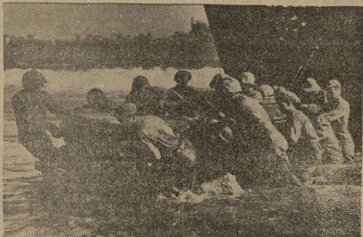
Soldados americanos de infantería de Marina, trasladan un "jeep" por la rampa de una unidad de desembarco en una isla del Pacifico.