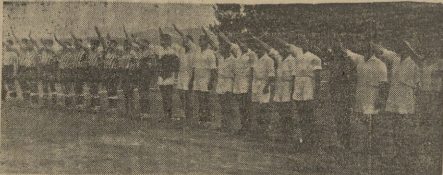
El Atlético y el Ceuta, alineados ante la tribuna presidencial, saludan antes de comenzar uno de sus reñidos encuentros. Esta foto, sacada hace 5 años, cobra actualidad hoy, ante el nuevo partido que jugarán esta tarde en Alfonso Murube

Otra vez van a ponerse frente a frente atléticos y ceutistas. Los rivales de antaño, aquellos que con sus épicas luchas salpicaron de interés y embriagaron de emoción a los aficionados de todo Marruecos, renovarán esta tarde en nuestro Estadio la tradición gloriosa de sus encuentros, la continuidad de las bellas contiendas balompédicas. Siguen siendo rivales como antes. Aunque actúen en categorías distintas, aunque sus colores no lleguen a chocar en el áspero y emocionante litigio de los dos puntos, merengues y roji-blancos han sabido conservar — a través del tiempo — la solera de su juego, la potencialidad de sus equipos, el fervor de sus incondicionales. Y llegan a este partido persuadidos de su calidad, convencidos de su fortaleza, respaldados por el griterío entusiasta y alentador de muchos miles de aficionados.