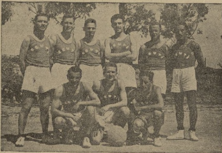
El equipo de baloncesto del Deportivo Ceuti, campeón regional en la anterior temporada y primer equipo que ostentando la representación de Marruecos participó en la Copa de S. E. el Generalísimo.

En la actualidad se está disputando el VIII campeonato de España, prueba en la que participan casi todos los equipos de