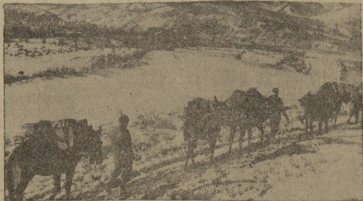
Una reata de mulas transporta provisiones a través de las montañas cubiertas de nieve hacia las posiciones avanzadas donde están las fuerzas inglesas en Italia.