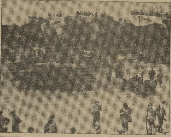
Formaciones francesas desembarcando en las costas de Italia, para reforzar el frente aliado.