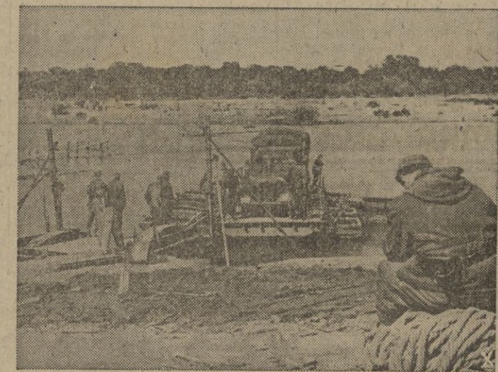
En el frente oriental, los ingenieros alemanes, llevan en barcazas improvisadas, bajo el fuego enemigo las provisiones de una ribera a otra.

Declaró entre otras cosas: "Hemos cumplido y seguiremos cumpliendo fielmente todos nues-