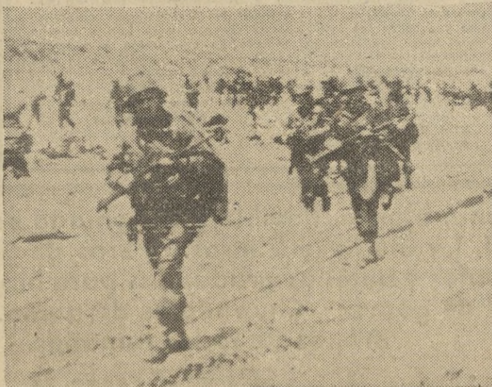
Infantes americanos, con los fusiles preparados, avanzan por una amplia zona arenosa de la playa en Normandía, después de su desembarco.