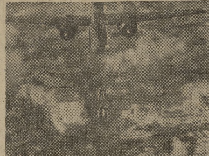
Un Havoc-20, de la Novena Fuerza Aérea norteamericana bombardea un importante empalme ferroviario alemán en la Francia ocupada.

***** Ataques a las comunicaciones alemanas *****