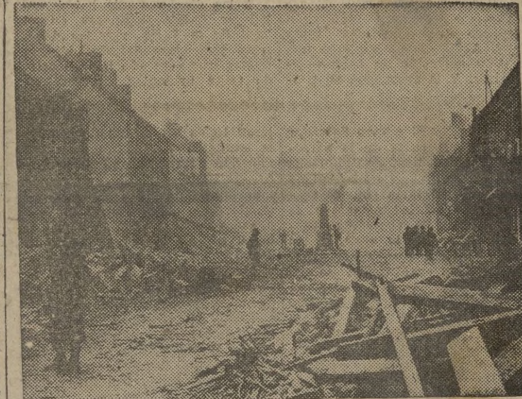
La infantería americana hace guardia en las calles derruidas de Isigny, después de la batalla por la ciudad