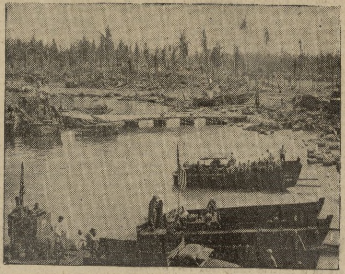
Tropas norteamericanas después de descargar material en las islas Wakda, recientemente conquistadas.

En Normandía, contrariamente a las noticias divulgadas por los aliados.