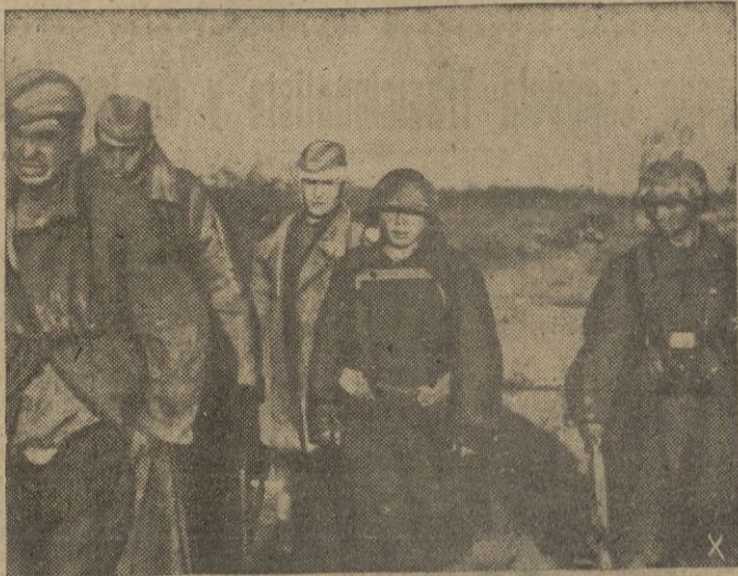
Un destacamento de choque alemán regresa de un servicio de exploración con prisioneros soviéticos.