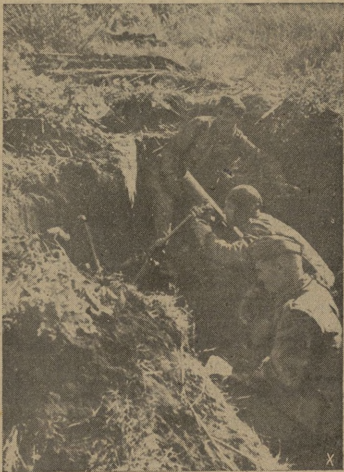
Puesto de lanzagramadas de una formación del ejército nacional ruso que lucha contra los bolcheviques