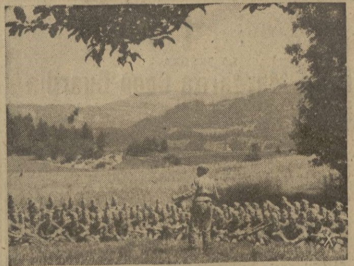
Las juventudes de Noruega, Dinamarca y Holanda, asisten a cursillos especiales que durante un mes se celebran en las comarcas más bellas de Alemania.