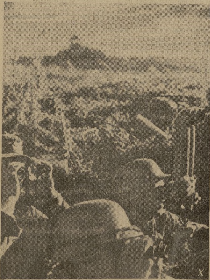
Soldados alemanes en un puesto avanzado de observación