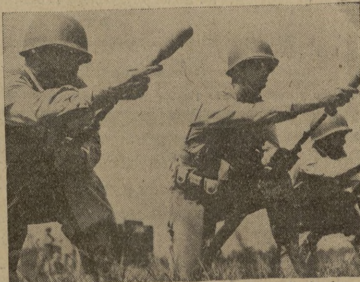
Soldados americanos practicando con los nuevos fusiles lanzagránadas.