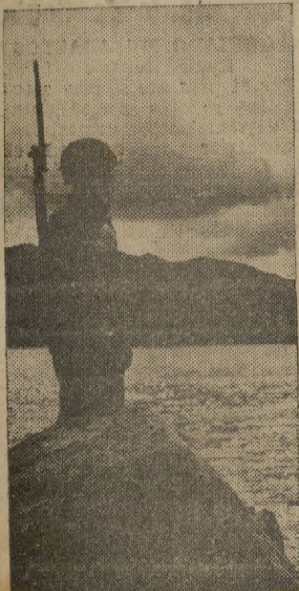
Soldado americano en vigilancia frente a las costas Aleutianas.