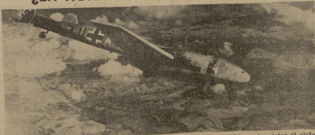
Después de su relativa inactividad, los bombarderos alemanes vuelven a inquietar el cielo de Londres. Tras las huellas de este antiguo destructor "Me 110", las nuevas oleadas de la Luftwaffe nos traen la máxima actualidad al primer plano de la guerra aérea.

Gran Cuartel General del Führer, 2. — Frente de Italia: Han ganado extensión los duros combates defensivos librados por nuestras tropas en la región occidental del frente meridional italiano. El enemigo, apoyado por un buen fuego de artillería, se lanzó al ataque de nuestras posiciones pero fué rechazado con sangrientas pérdidas, cerrando nuestros soldados una brecha local. Un contraataque germano al NO. del Minturno ha obtenido algunos éxitos a pesar