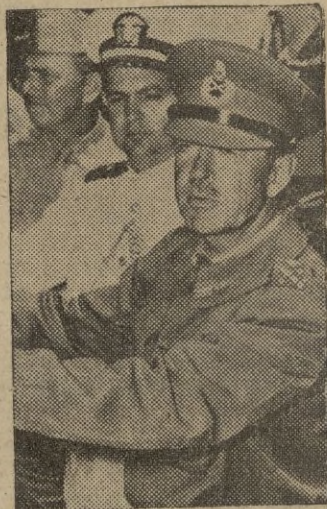
El general Alexander