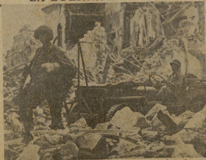
Los soldados norteamericanos a través de las ruinas de una ciudad italiana del frente.