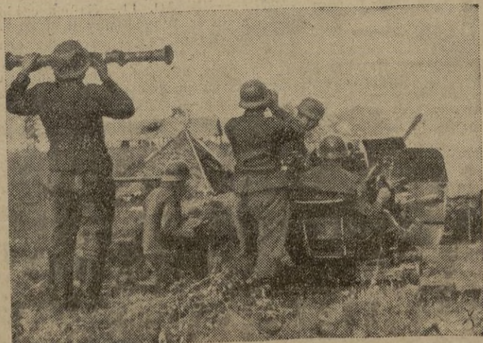
Antiaéreos ligeros alemanes, atacan con tiro directo las posiciones avanzadas y fortines de los soviets

Cuartel avanzado de las fuerzas aliadas en el Mediterráneo, 11.--Parte de guerra: