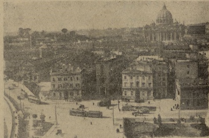
He aquí uno de los barrios que recientemente han sufrido los efectos de las bombas.

Manzanas enteras de casas quedaron destruidas