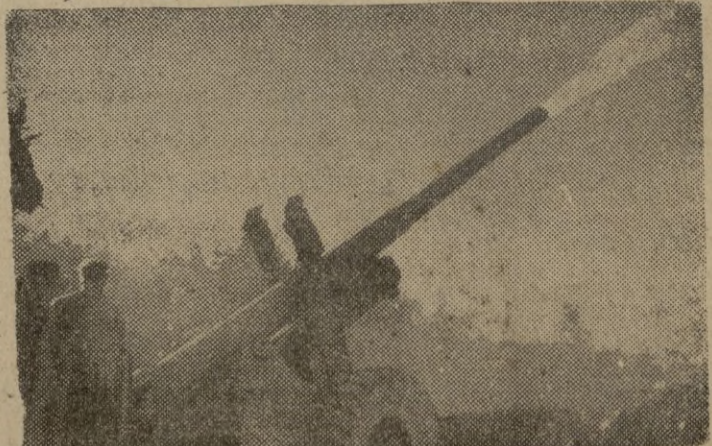
Un cañón mediano, de 115 milímetros, británico, disparando en el frente de Monte Cassino.