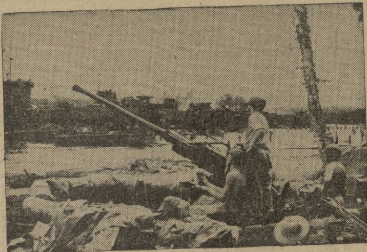
Antiaéreos aliados emplazados en el frente italiano.

Montevideo, 18.—En los centros políticos se afirma que el general Ramírez, presidente de la República continuará rigiendo la política nacional y el Ejército, hasta después de Páscoa, por lo menos. Ramírez se encuentra respaldado por numerosos oficiales del Ejército y cuenta también con el apoyo de los liberales, los cuales tienen un cambio político que podría traer al poder a un presidente más aislacionista que el actual.—EFE.