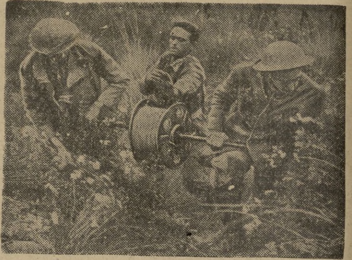
Por las vertientes de Monte Cassino, los soldados de Transmisiones tienden los hilos telefónicos que parten del puesto de mando.