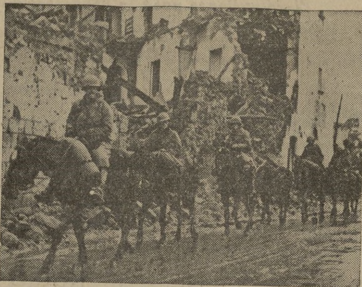
Caballería norteamericana del V Ejército atraviesa una ciudad italiana después de una batalla