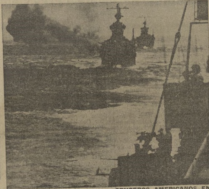
CRUCEROS AMERICANOS EN ACCION CONTRA UNAS POSICIONES JAPONESAS DEL PACIFICO