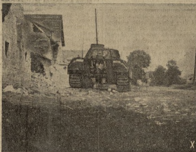
En el sector de Tilly los tanques alemanes montan guardia