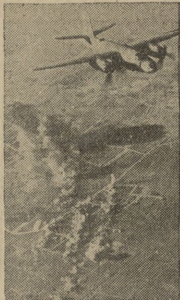
Un "Marauder B-26" norteamericano, se aleja de un aeródromo alemán en Holanda, después de descargar sus bombas