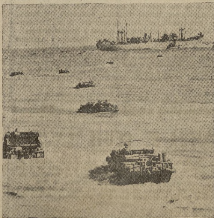
Camiones anfíbios que trasladan provisiones desde los mercaderes a la playa, para las tropas aliadas en el sector de la Italia occidental.