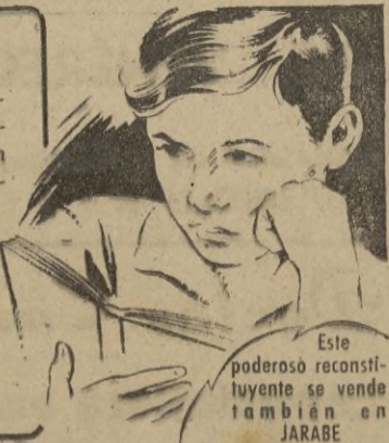
Este poderoso reconstituyente se vende también en JARABE

El esfuerzo mental del estudio, que es un desgaste nervioso, puede ser peligroso para un muchacho de constitución débil; por ello le conviene tomar diariamente Compridos Salud cuya composición a base de fosforo, calcio y hierro fortalece el organismo, tonifica el sistema nervioso y aleja el peligro de anemia.