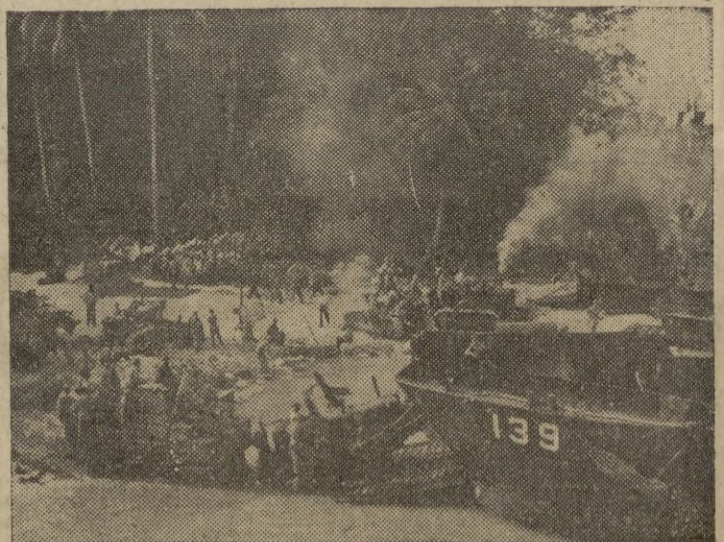
Tropas norteamericanas emplean tractores orugas para descargar las unidades de desembarco en las costas normandas