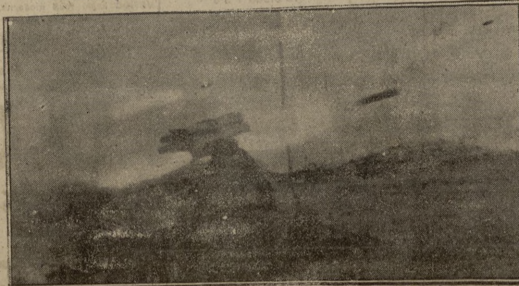
Un lanzanieblas de la División Gran Alemania, en plena acción en el frente de combate.