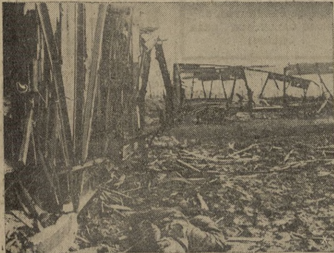
Los bolcheviques intentaron irrumpir en las líneas alemanas a lo largo de la línea férrea. La foto demuestra la intensidad de la lucha.

Berlín, 24.—La Oficina Internacional de Información declara acerca de la situación en el frente del Este: