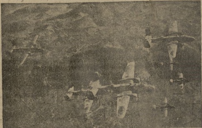
Bombarderos "Marauder" volando sobre las comunicaciones de la Italia central