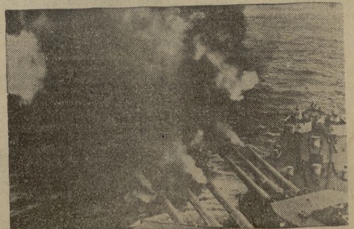
Los cañones de un crucero americano lanzan sus andanadas contra las instalaciones japonesas en el Pacífico