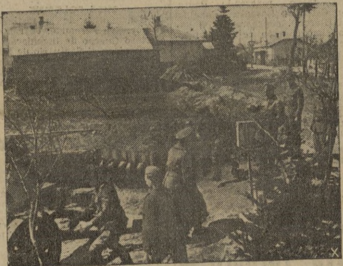
El Mariscal Model, poseedor de dos Laureadas, asiste a prácticas que se están realizando con un nuevo cañón antitanque pesado