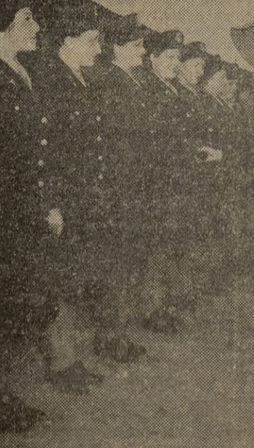
La reina Fawzia, del Irán, hermana del rey Faruk de Egipto, estrecha la mano a las enfermeras americanas destacadas en una base del Golfo Pérsico