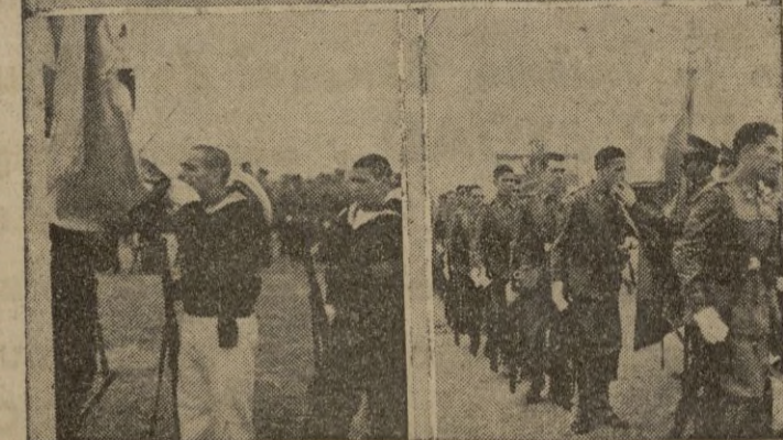
Cuatro aspectos de la magnífica jornada del domingo, con motivo de la Jura de la Bandera por los nuevos reclutas. En primer término una vista del altar. La presidencia en el momento del desfile. El teniente coronel García Valiño, pronunciando la fórmula del juramento y dos instantáneas del momento solemne en que los nuevos soldados de España, besaban la sagrada enseña.