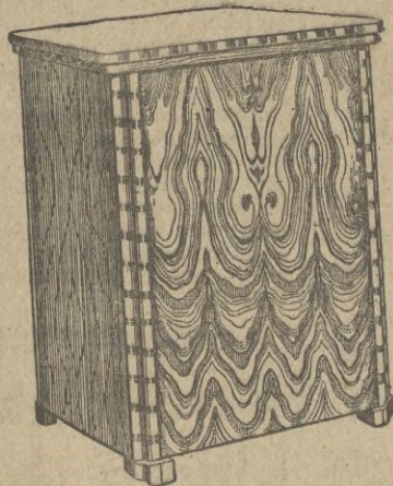
MODELOS GRAN LUJO