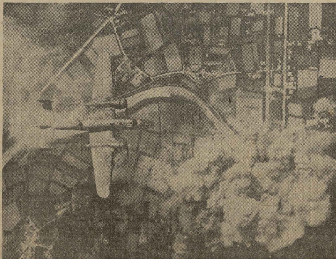
Un bombardero "Mitchell B-25", perteneciente a una formación de aparatos, bombardeando un puente ferroviario de Pietrasanta.