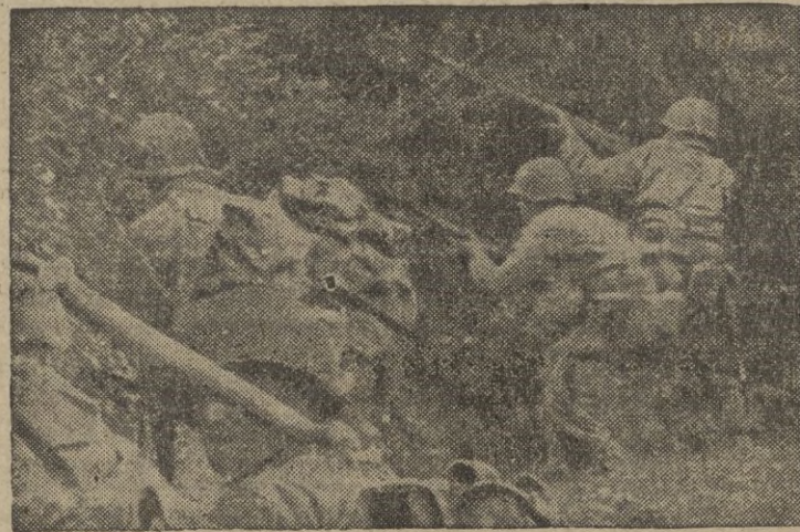
Infantería norteamericana que ha saltado a una zanja y se prepara a disparar un fusil lanzagranadas.