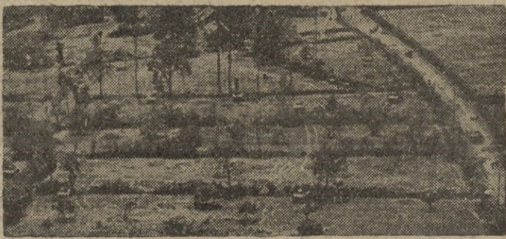
Tanques americanos avanzando entre los setos y por una carretera francesa

aviones y armas su trabajo que ha permitido alcanzar «hermosas victorias actuales».