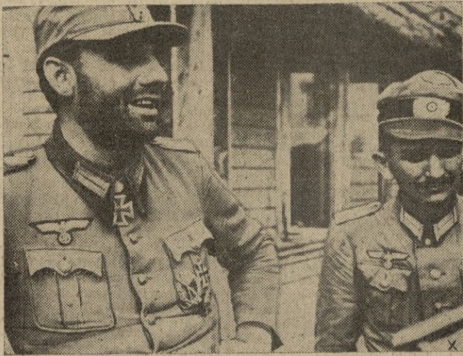
El coronel Tolstorf, condecorado con la Cruz de Caballero con Hojas de Roble, después de haber conseguido salvar a sus tropas cercadas, penetrando a través de los sitiadores bolcheviques.