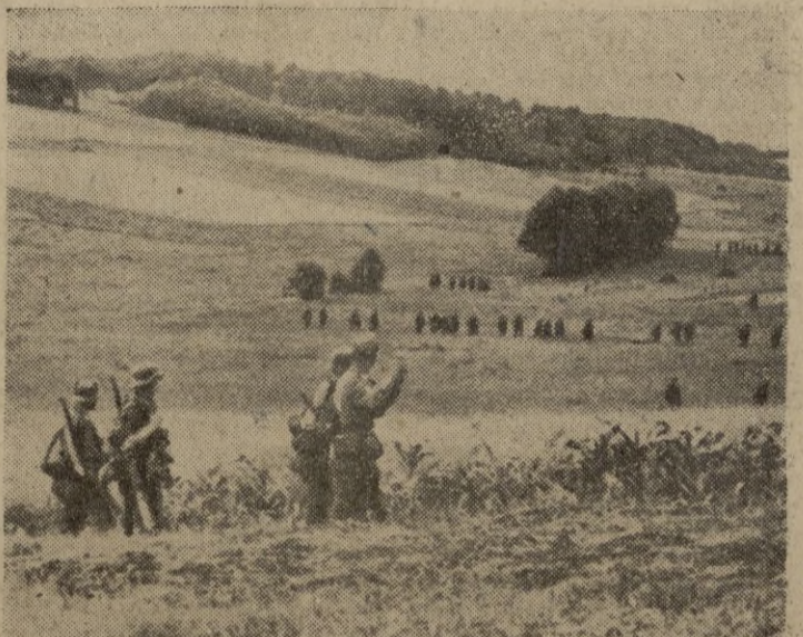
Tropas alemanas se despliegan por la llanura, para lanzar un ataque contra los soviéticos, que tratan de avanzar