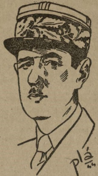
Paris, 20. -- En avión salió De Gaulle para los Estados Unidos, a medianoche. -- EFE.