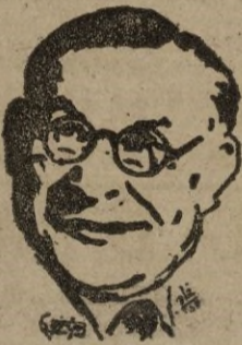
Londres, 20. -- El debate sobre política exterior en la Cá-

«La cuestión del régimen español es una cuestión que tiene que decidir su PROPIO PUEBLO»