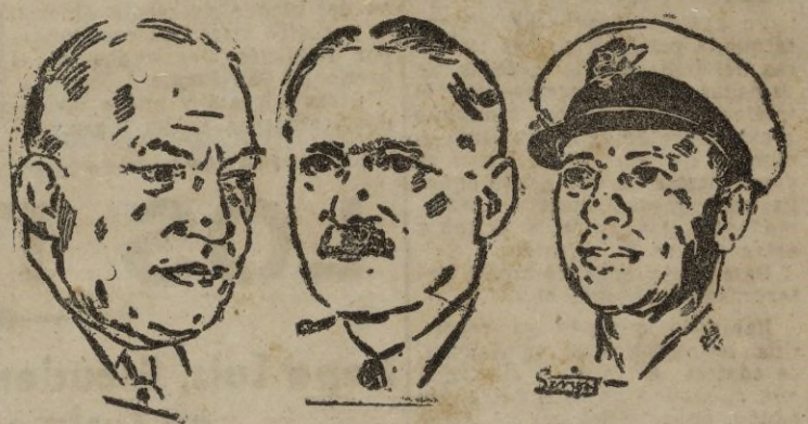
Harry H. Arnold, jefe del Estado Mayor del Aire de las fuerzas norteamericanas, general Spaatz, jefe de las fuerzas de bombardeo del Ejército del Aire y general George C. Keney, jefe de las fuerzas tácticas de Aviación. Los conjuntos han realizado los desastrosos bombardeos aéreos sobre el Japón cuyas consecuencias fueron la capitulación incondicional tras el empleo de la bomba atómica, caída sobre Hiroshima y Nagasaki. —.