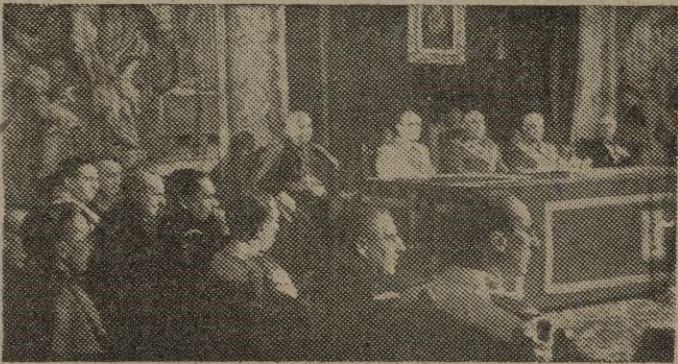
El Caudillo acompañado del Gobierno y altas personalidades eclesiásticas y civiles, clausuró la VI sesión plenaria del Consejo Superior de Investigaciones Científicas.