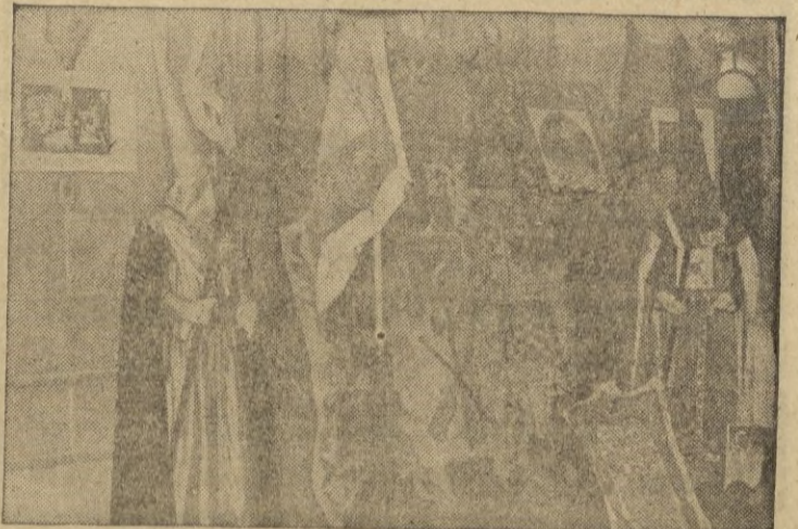
Un detalle de la Exposición de la Semana Santa de Málaga, que ha sido brillantemente clausurada en el Centro de Hija de Ceuta

Visite el BAR RESTAURANTE Las dos CC LE AGRADARA Vinos de Moriles. Cocina esmerada. Millán Astray, 4. Tlf. 274