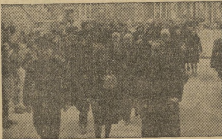
El vicesecretario de Secciones, la delegada nacional de la Sección Femenina y otras autoridades se dirigen a la Abadía de San Telmo, donde tuvo lugar la solemne clausura del Consejo de la Sección Femenina.