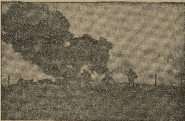
Fuerzas aliadas realizan una operación en las cercanías de la línea Sigrido.

de Naumburg; han sido eliminadas por las tropas alemanas, según anuncia la Oficina Internacional de Información. — EFE.