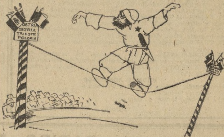
—El batacazo va a ser de...—