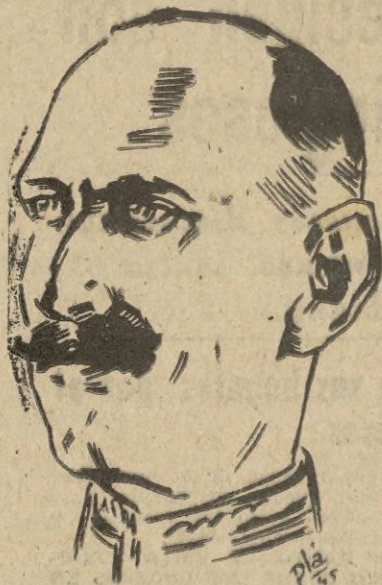
Oslo, 2.—El rey Haakon de Noruega regresará a la capital de su país el próximo día 7.—EFE.