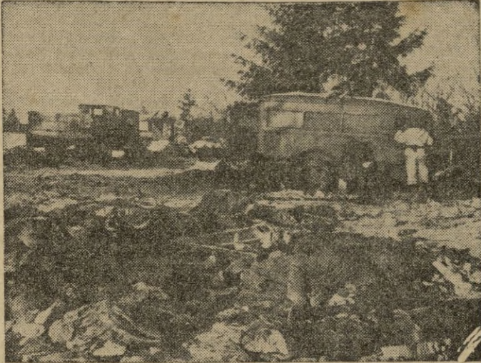
La dureza extremada de la lucha en las islas del Pacífico, ocasionan innumerables víctimas. La foto recoge una escena verdaderamente dramática, donde los equipos sanitarios, actúan con intensidad.