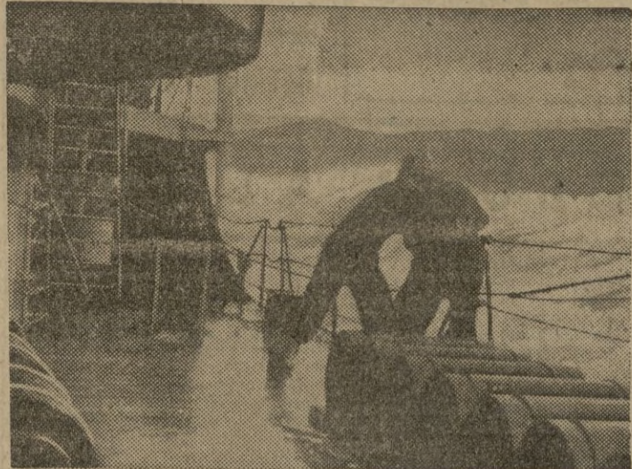
Los buques patrulleros británicos montan su guardia en el Atlántico, a pesar del fuerte temporal reinante.