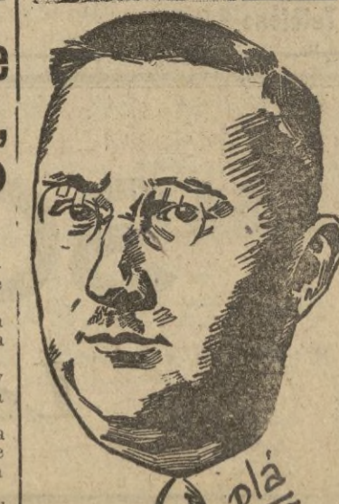
(Información en página 5)

En estos momentos en que el balance de daños de la más terrible guerra jamás sufrida por la humanidad comienza a mostrar el espanto de sus cifras astronómicas, un nombre ha de brotar con gratitud en los labios de todos los españoles bien nacidos: el de Franco, artífice de nuestra neutralidad, que con ella supo librarnos de los horrores de la lucha fratricida que ha terminado.