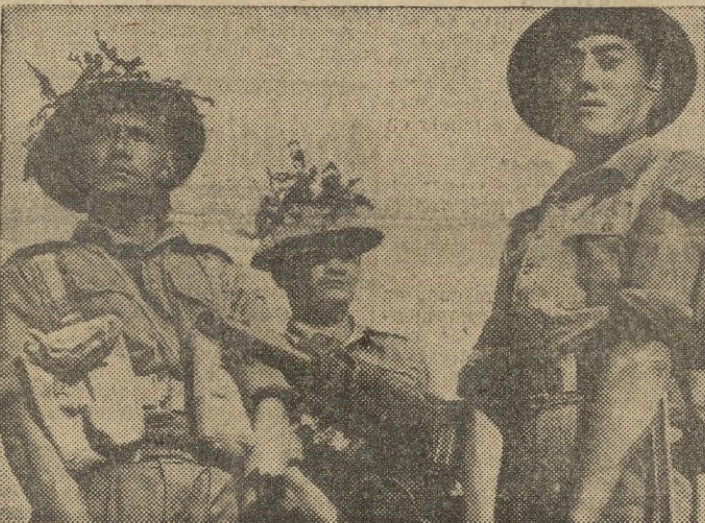
Soldados británicos capturan una ametralladora japonesa en una isla del Pacífico.